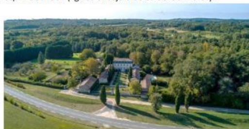
21-18e – REVISION ALLEGEE DU PLUI DE LA COMMUNAUTE DE COMMUNES DU CREONNAIS ORIENTATIONS D'AMENAGEMENT ET DE PROGRAMMATION Juillet 2022

Des éléments apparaissent majeurs dans la qualité paysagère des lieux (le parc boisé, la présence d'un arbre remarquable /noyer) quand d'autres se révèlent sans cohérence avec l'esprit des lieux (lignes et sujets isolés de conifères).